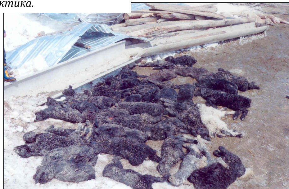
Массовая гибель домашнего скота в Кара-Кулжинском районе, март 2012 год.